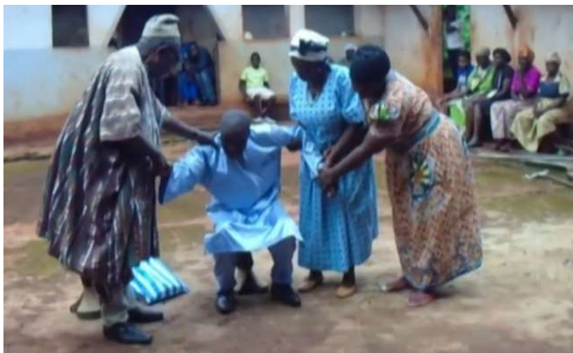
Figure 3 : Installation symbolique sur le tabouret à trois pieds