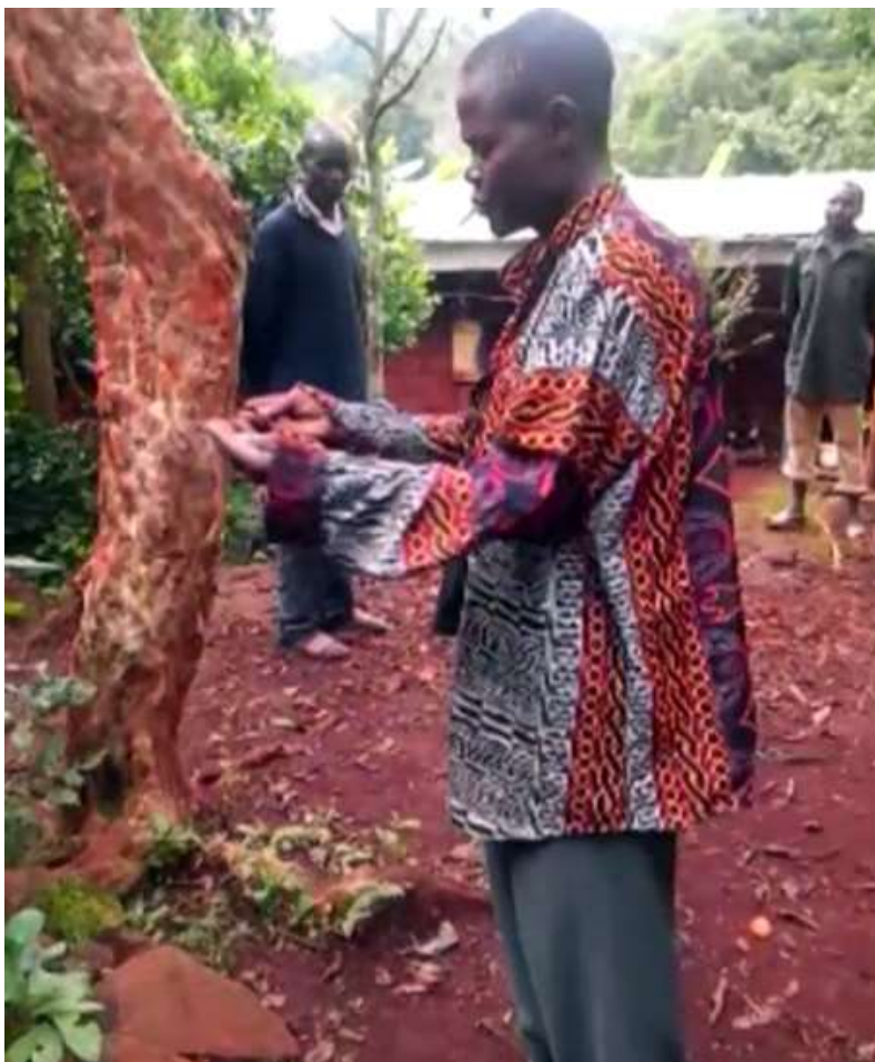
Figure 1 : Geste de requête effectué lors d'un rite d'intercession