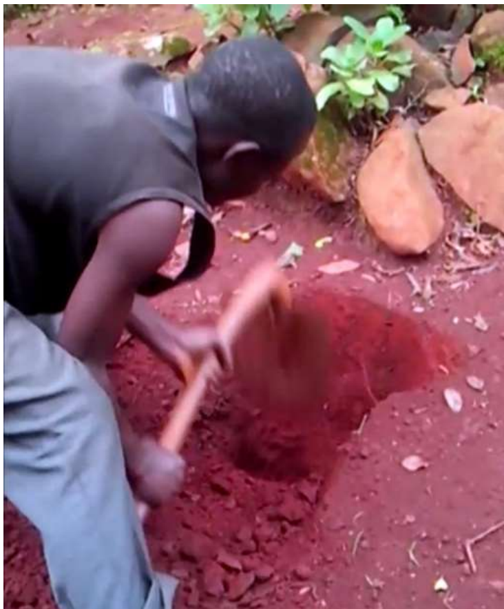
Figure 2 : Creusement du shop