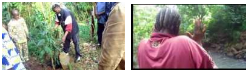
Photo C : Sacrifice rituel