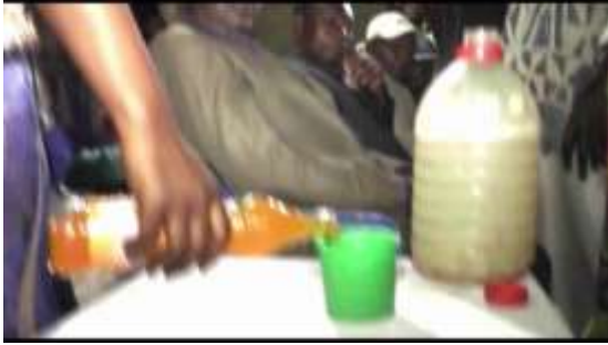
Photo E : Rite de mariage traditionnel