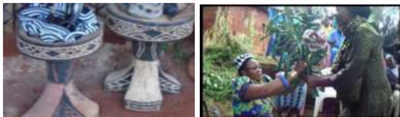
Photo B : Rite donnant accès à s'asseoir sur le tabouret