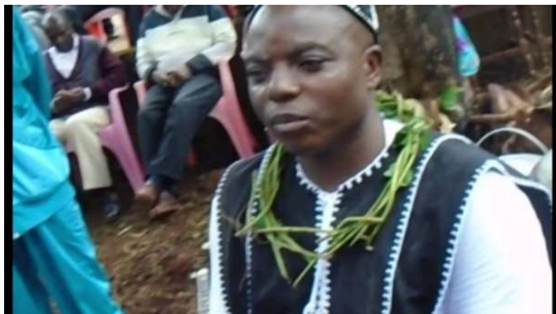
Figure 5 : Port du collier traditionnel