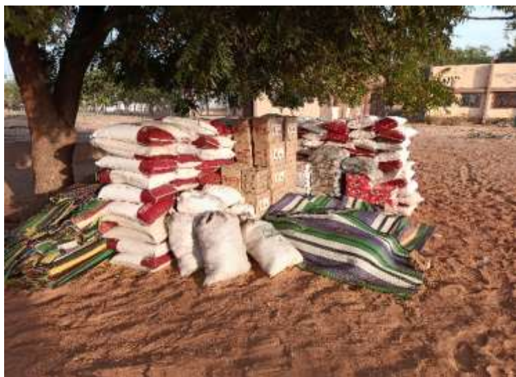
Photo n°4 : Don de l'ONG humanitaire Direct aid au secours des sinistrées des inondations de Malanville

Source : Image en date du 11 décembre 2025.