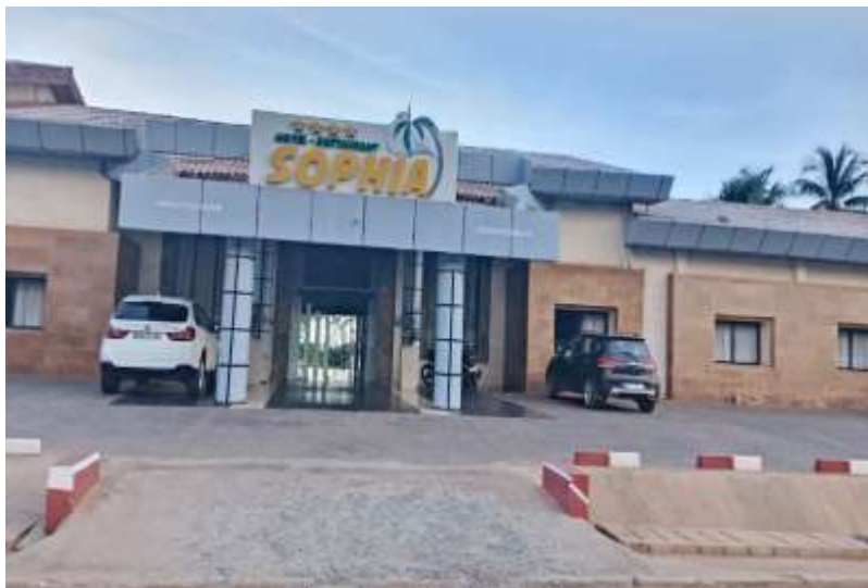
Photo 6 : L'Hôtel Sophia sur le littoral Balmer