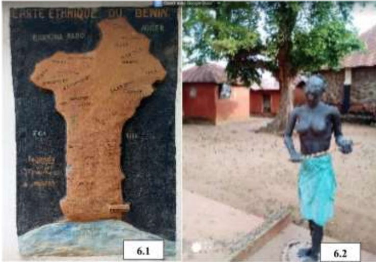
Planche 6 : Musée ethnographique Alexandre Sènou et Musée Honmè à Porto-Novo

La planche 15 montre le musée ethnographique Alexandre Sènou et le musée Honmè à Porto-Novo.