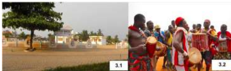
Planche 31 : Place NONVITCHA avec une célébration de la fête de centenaire à Grand-Popo

Prise de vues : Babio E. K., Juillet 2021