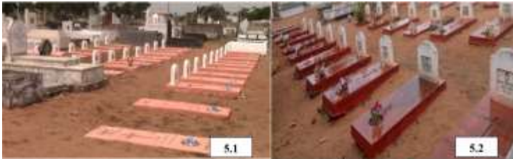
Planche 5 : Cimetière catholique et tombes des premiers missionnaires du royaume du Danhomey

Agouégan et Agokpamé) sera cédée à l'Allemagne », ajoute-t-il (planche 1).