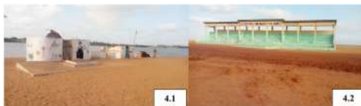
Planche 4 : Place du 10 janvier à Gbècon (Grand-Popo)

est devenu un site touristique pour les touristes de la sous-région et du monde entier à la date du 10 janvier de chaque année (planche 4).