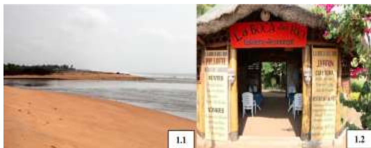
Planche 1 : Bouche du Roy à Avlo (6.1) et restaurant de la BOCA del RIO à Grand-Popo (6.2)

La bouche du Roy s'étend sur les Communes de Grand-Popo et de Comè. Selon les enquêtes de terrain, elle couvre une superficie de 9 678 ha. La planche 1 présente quelques parties de la bouche du Roy à Avlo.