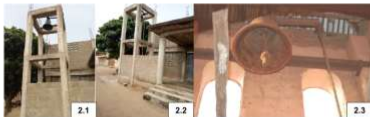
Planche 2 : Église Protestante à Agoué (Commune de Grand-Popo)

anglais ont laissé un signe de leur passage : l'Église protestante, qui conserve encore sa cloche originelle de 1864. Le passage par la maison du capitain portugais Gonçalves, bâtie par ses esclaves sera l'occasion d'une rencontre avec ses descendants (planche 2).