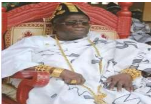
Photo n° 8 : Sa Majesté Nanan Boa Kouassi III, 17 ème Roi des n'dénean