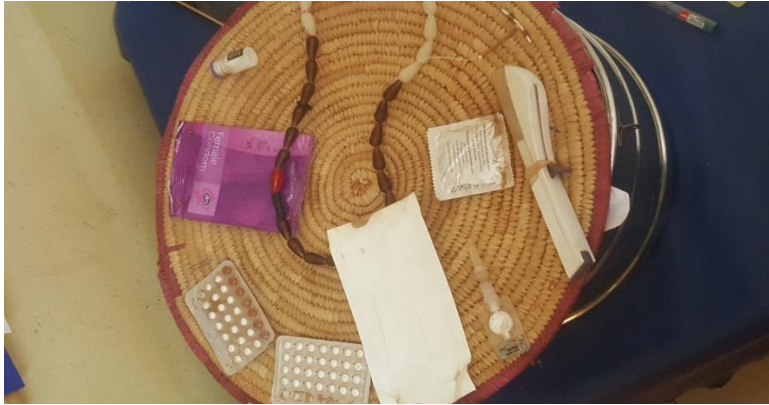
Figure 3 : Les différentes méthodes contraceptives (Niveau individuel et communautaire)