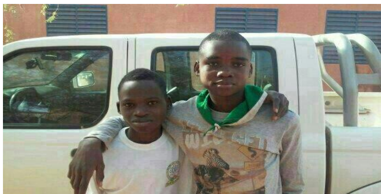
Figure 2 : Photo de deux adolescents (Niveau individuel)