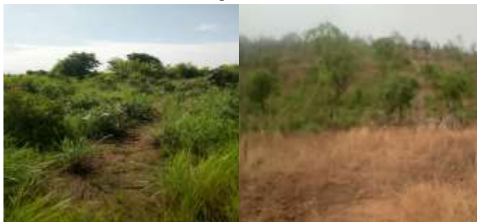
Photo 1 : Portions de terres inexploitable dans la Commune de Matéri