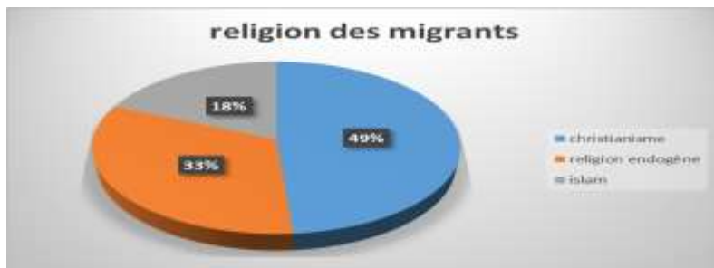
Graphique 1 : Répartition des sensibilités religieuses concernées par l'émigration à Matéri